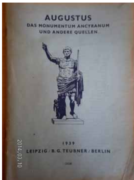
Portada del ejemplar escolar sobre las fuentes de Augusto, publicado en la Alemania Nazi.