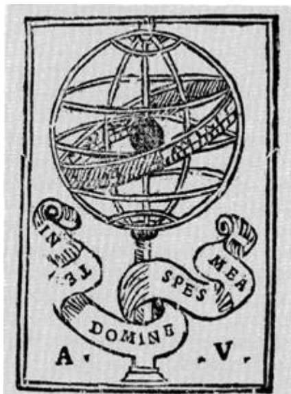
Marca do impressor Duarte Pinel, alias Abraão Usque

político, económico e científico, proporcionado pelas navegações portuguesas. A esfera armilar, em simultâneo instrumento de observação e modelo do próprio universo, foi adoptada por D. Manuel como emblema pessoal, dando assim a imagem perfeita da vastidão geográfica do império lusitano.